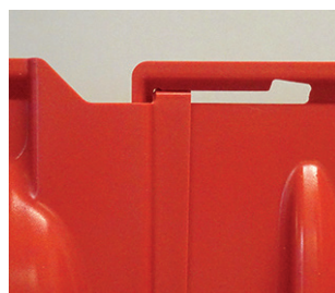
3° åt ena hållet