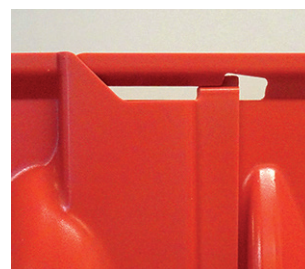
3° åt andra hållet